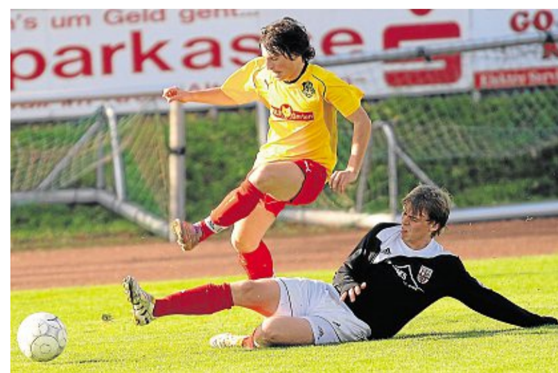
Die Hürde TuS Mayen haben die B-Junioren der SG 06 Betzdorf (links) genommen. Dabei musste ein Elfmeter die Entscheidung bringen.