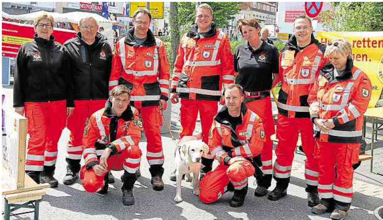
Blaulichtmeile: Diese Rettungshundestaffel macht auf ihre teils schwierige Arbeit aufmerksam. Zahlreiche weitere Hilfsorganisationen geben jeweils einen Einblick in ihr Schaffen.