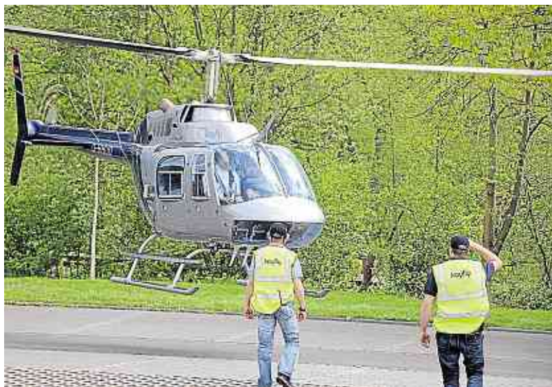
Vogelperspektive: Viele Gäste nutzen die Gelegenheit, sich die Kreisstadt bei einem Hubschrauberrundflug von oben anzuschauen.