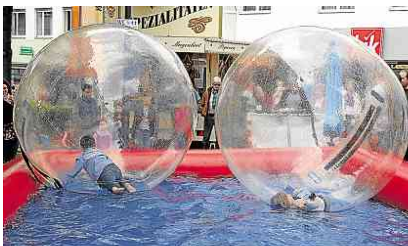
Wasserkugel: Trocken überstanden Kinder den Ausflug in die Plastikrundung, die in dem kleinen Bassin schwimmen.