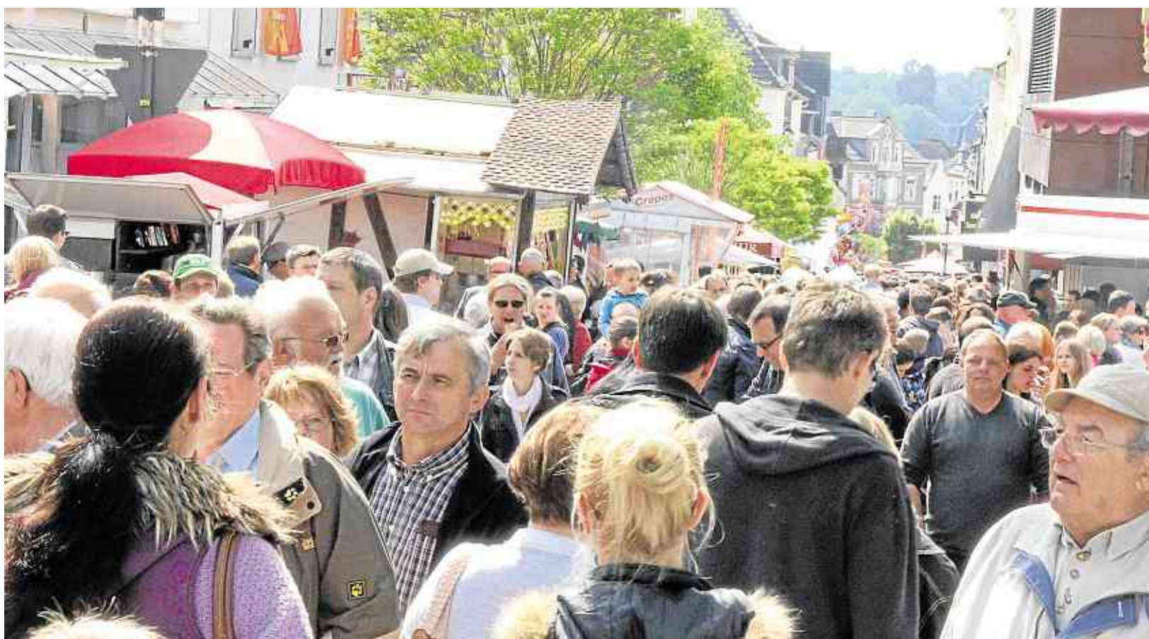
Publikumsverkehr: Dicht an dicht drängen sich bei herrlichem Wetter am Sonntagnachmittag die Menschen in der Fußgängerzone, genießen die zahlreichen Aktionen und besuchen die Geschäfte, die verkaufsoffen sind.