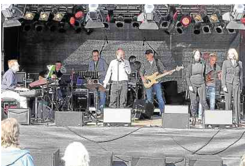
Livemusik: Tribute to Joe (Cocker) steht stellvertretend für hervorragende Musik der guten Coverbands, die auf der Schlossplatz-Bühne spielen.