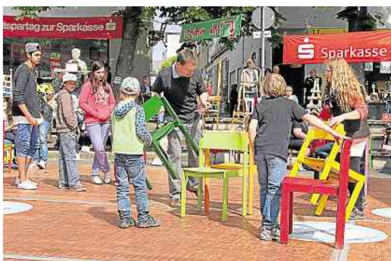
Stühlerücken: Auf dem Marktplatz wird allerhand mit allen möglichen Sitzgelegenheiten im Rahmen „700 Jahre - 700 Stühle“ angestellt.